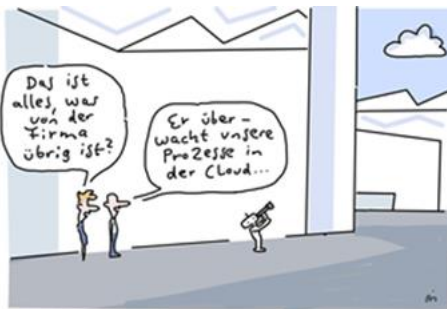
Cartoon von Dirk Meissner