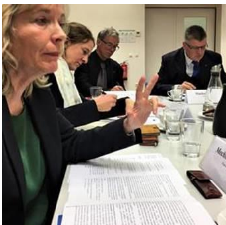
Teilnehmer des wissenschaftlichen Gremiums des LRH